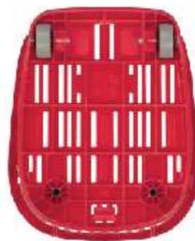
Bond 2: 2 ruedas fijas | 2 fixed wheels

Nueva cesta monobloc. New monobloc basket.