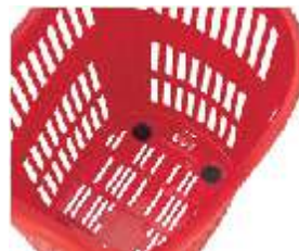
Fondo plano / Flat bottom surface