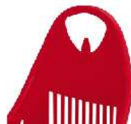
Gancho para bolso / Bag hook