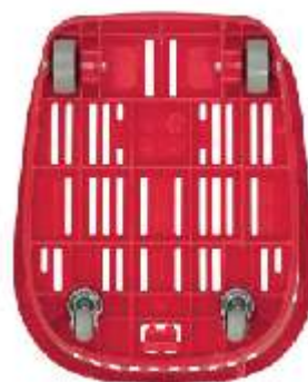
Bond 4 : 2 ruedas fijas + 2 ruedas giratorias | 2 fixed wheels + 2 revolving wheels

Greater resistance and capacity, now in just one piece!